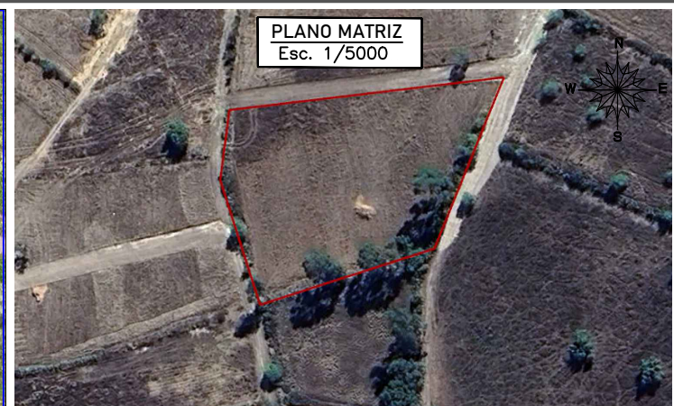
PLANO MATRIZ Esc. 1/5000