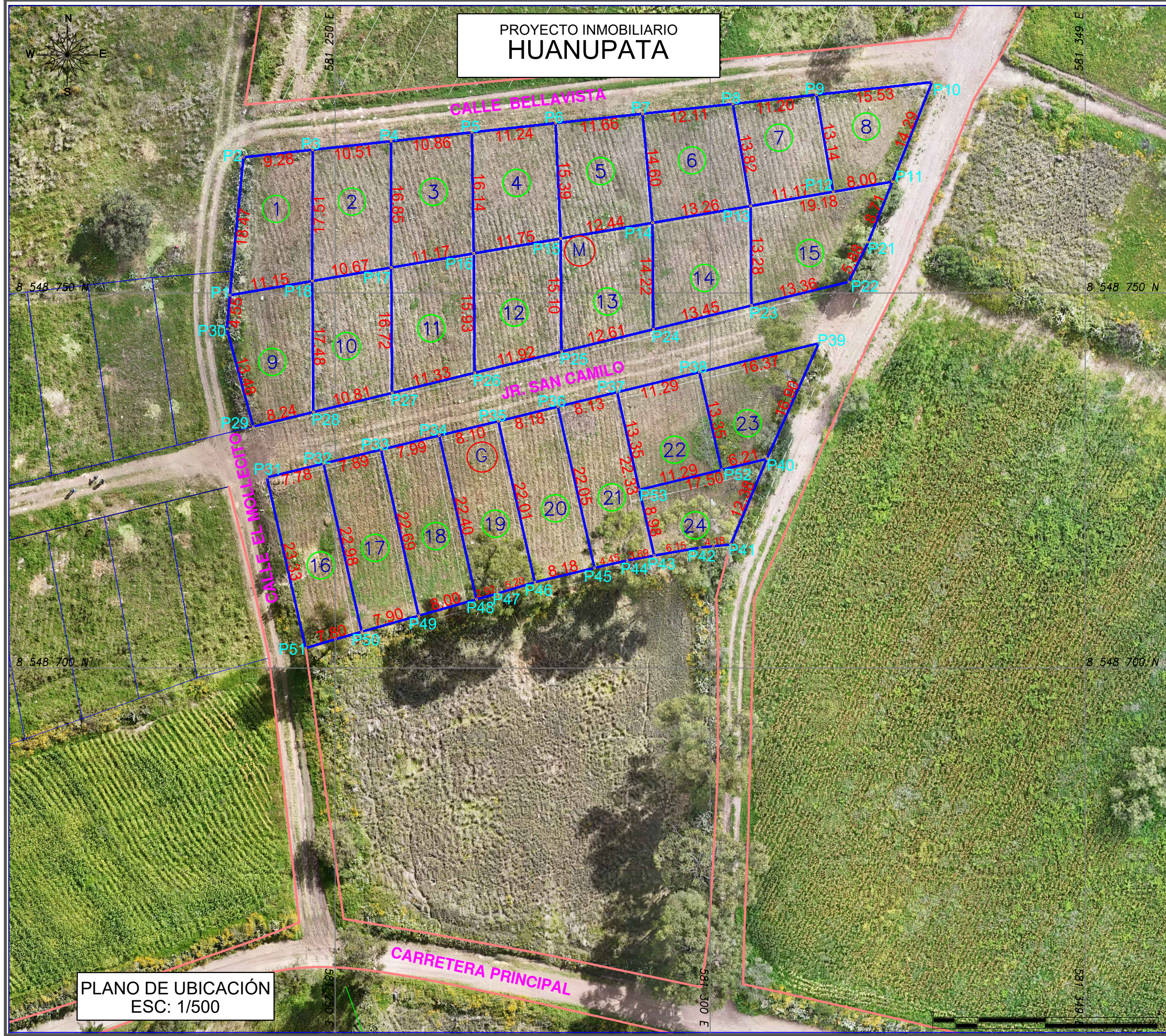
PLANO DE UBICACIÓN ESC: 1/500